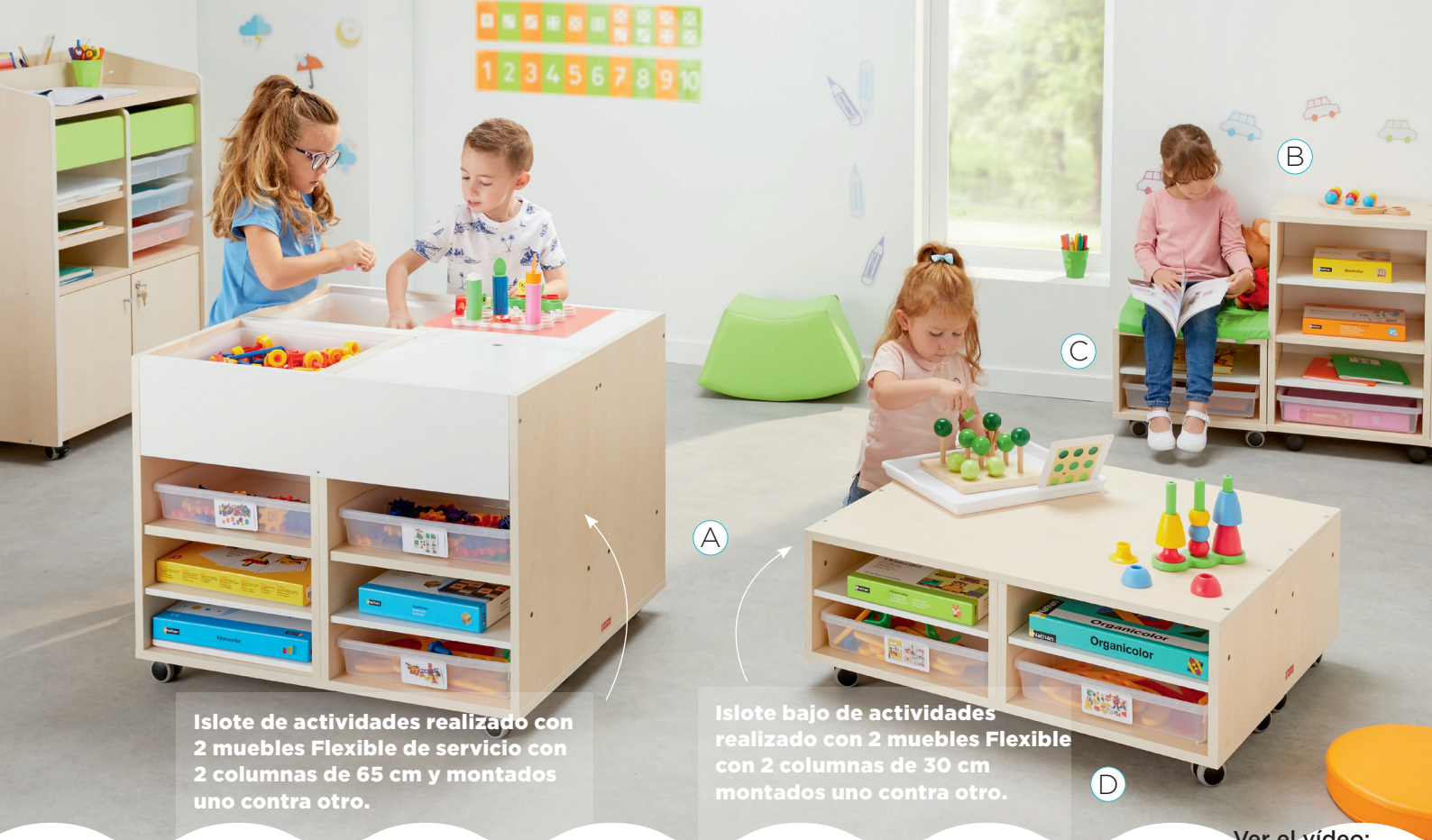
Islole de actividades realizado con 2 muebles Flexible de servicio con 2 columnas de 65 cm y montados uno contra otro.