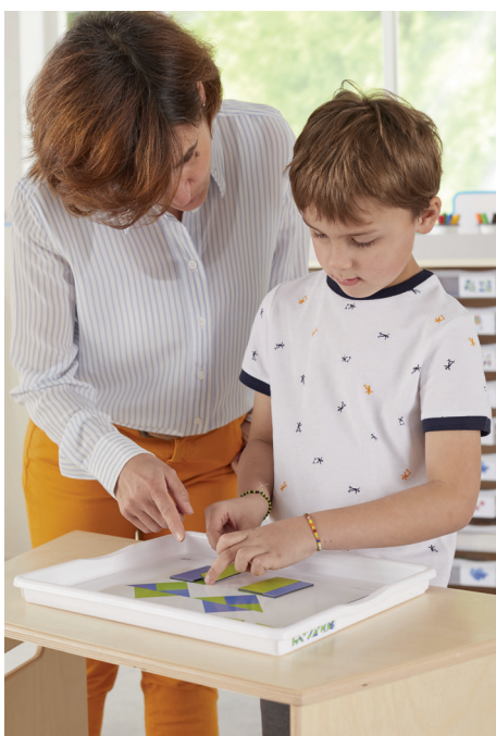
Las actividades se pueden realizar directamente en las bandejas.

Un juego de ruedas que se vende por separado facilita el desplazamiento de los muebles según las actividades y los horarios de clase. Los muebles altos y las columnas de almacenaje completan la gama.