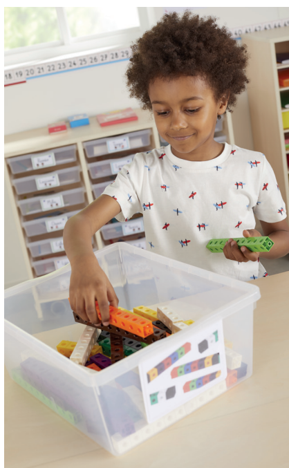
Los cajones de plástico transparentes tienen una gran capacidad y pueden acomodar tapas.