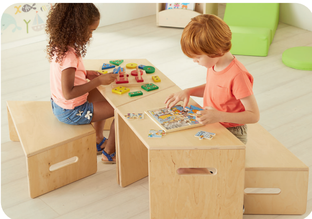
Configuración en línea