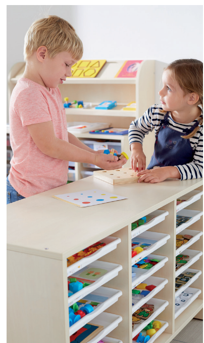
Los muebles de 59 o 77 cm de altura también sirven como soporte para actividades.